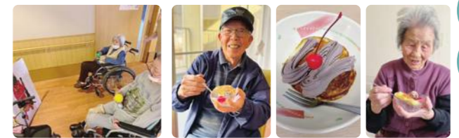
バレンタインパンケーキ作り