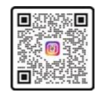
パン工房しらとり and カフェパン