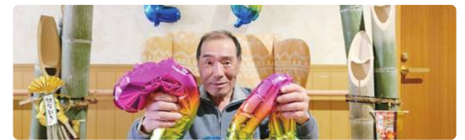
新年会ステキに撮りましょ