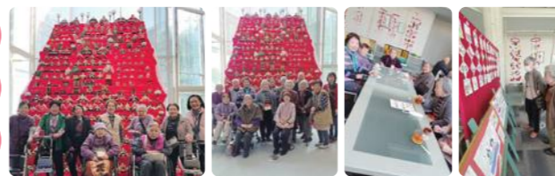
アルテリオお雛様見学ツアー