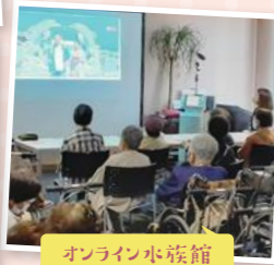
オンライン家族館