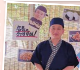
オープン8周年居酒屋