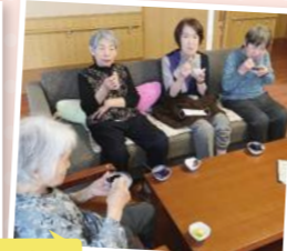
6月 父の日&おやつパーティー