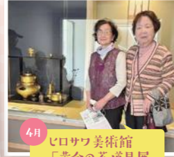
4月 ヒロサワ美術館 「黄金の茶道具展」