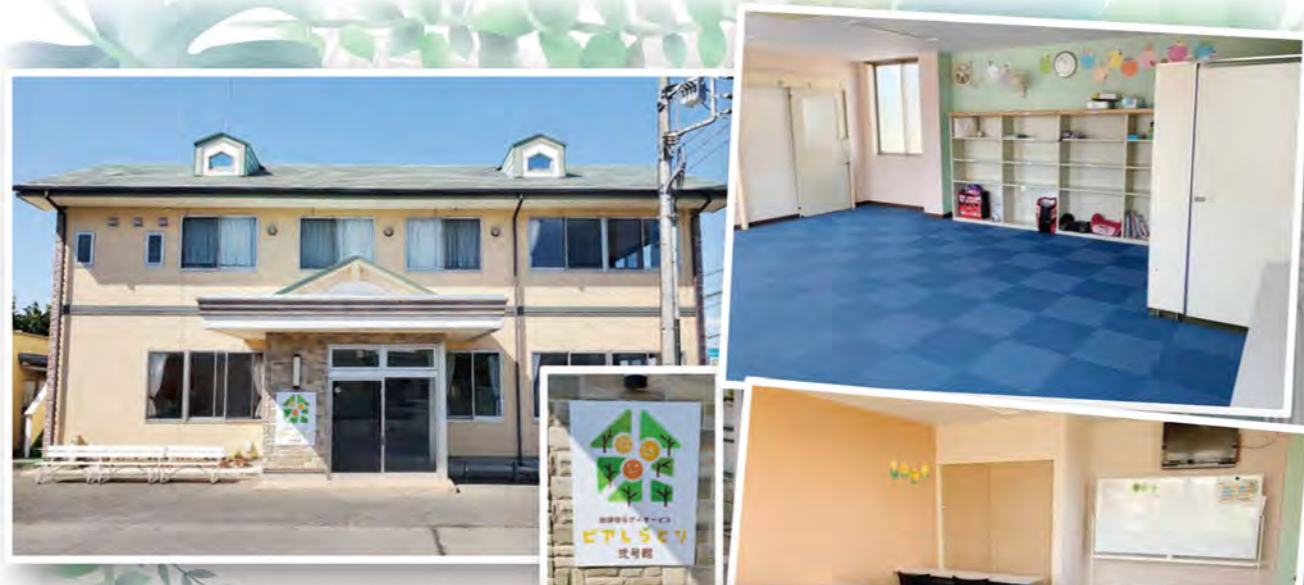
ピアしらとり放課後等デイサービス式号館 open

パン工房しらとり上平塚店/ CAFEラパン 茨城県筑西市上平塚591-1 ☎0296-45-8085