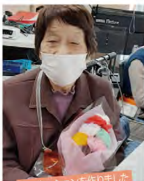
カーネーションを作りました