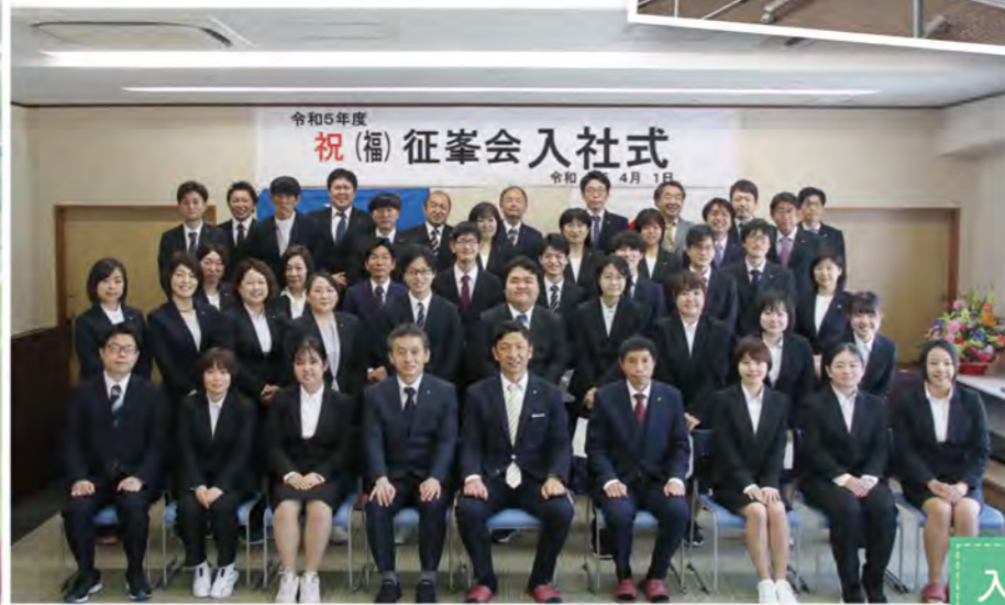
令和5年度 祝(福) 征峯会入社式 令和5年4月1日