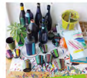
あとりえずーむ様