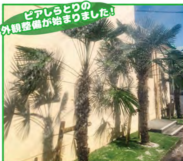
ピアしらとりの 外観整備が始まりました!