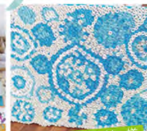
ユアファクトリー様

各施設のアート活動を見学しました。利用者様のこだわりや関心を活かして作品制作を行っていました。支援員が利用者様の特性に合わせて使いやすいように工夫した材料と方法を提供し、一緒に取り組む様子が印象的でした。商品化や実際の活動の話を聞くことができ、参考になるアイデアをたくさん学ぶことができました。利用者様がアートを通して自己表現をし、作品を通して地域や社会とつながることができる素晴らしいと感じました。