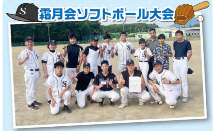
S 霜月会ソフトボール大会

筑西市役所 (株)ムコウダ (株)三友企画 (株)LIXIL 大和ハウス工業(株) 日本電解(有) 農業協同組合 きらいち筑西店 きらいち結城店 道の駅グランテラス筑西 ヨークベニマル筑西横島店 (有)ライズ 下館バラ イオンズクラブ 下館ゴルフ倶楽部 愛泉学園 認定こども園せきじょう 認定こども園ときわの杜 もみの木保育園 たちばな保育園 結城市役所 茨城県県西教育事務所 筑西保健所 三岳荘小松崎病院 アステラス製薬(株) (株)にのみや工務店 (株)セキショウライフサポート (株)ユニゾンモバイル デイサービスセンター きたはら フレクストロニクス・インターナショナル(株) (敬称略 順不同)