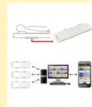
※画像、眠りSCANの説明の一部をパラマウントベッドホームページより引用しています。

●眠りSCAN(ねむりスキャン)とは？ 眠りSCANとは、マットレスの下にシート状のセンサーを敷きこみ、ベッド利用者の呼吸数や心拍数、睡眠状態、覚醒、起き上がり、離床動作などを遠隔においてリアルタイムに把握することができるセンサーです。センサーで感知した離床動作等はパソコンを通じて職員に知らせるシステムとなっております。眠りSCANを活用することでケアプランの改善や職員の業務負担軽減を行うことができます。