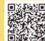
お祭りの様子動画