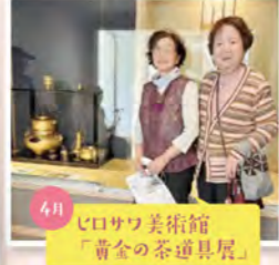
4月 ヒロサワ美術館 「黄金の茶道具展」