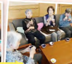
6月 父の日おやつパーティー