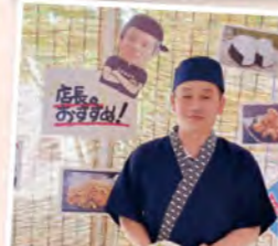
オープン8周年居酒屋