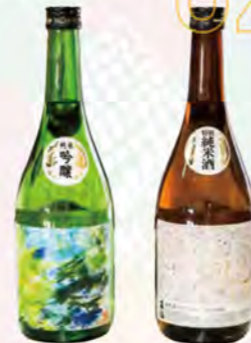
純米吟醸 720ml 1,870円(税込) 特別純米酒 720ml 1,650円(税込)

2月に行われたアートワークショップの絵やピアしらとり利用者様の絵を福祉デザイナー NODD がミックスしたアートパネルが、筑西市 20 周年記念事業として市役所に設置されました。