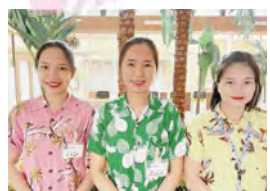
外国人技能実習生、受入開始！