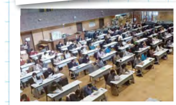
選択理論心理学本格導入！