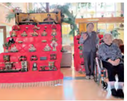
各ユニットではひな祭りのお祝いとして昼食づくりを行いました。ご入居者様にも春の訪れを感じていただく良い機会となったと思います。 特養しらとりでは毎年恒例のひな壇をホールに飾りました。