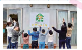
放課後等デイサービス ピアしらとり OPEN！