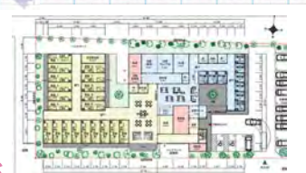
小規模多機能型事業所 準備委員会立ち上げ！