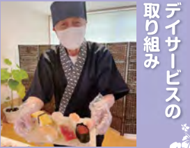
迫力ある赤鬼と青鬼 スタッフが寿司職人として振りました しらとり寿司完成です