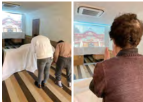
新年の願い事を喝えました