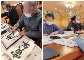
みんな真剣に書いています♪