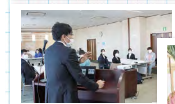
法人本部に人事部設置！