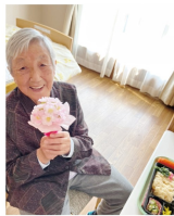
お弁当を召し上がるところ