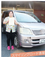
スマイリングロード表彰

今期のお楽しみ教室では今までの個人製作ではなく、参加される皆さんと一つの作品を制作しました。お客様同士で作業を分担されお互いに教え合いながら楽しく制作する姿が見られました。興味関心をもって沢山のお客様が参加してくださり、満足のいく出来上がりになりました。完成した作品の前で記念撮影をし、笑顔いっぱい素敵な思い出ができました。 （ハイアンデイサービス 介護員 栗田）