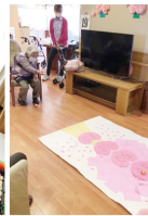
桜の玉投げゲーム