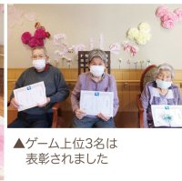
▲ゲーム上位3名は表彰されました

中々外出できないご時世に、少しでもお花見気分を楽しく頂けたらと考え「お花見気分を満喫しちゃうお」が行われました。ユニット内を春らしく装飾したり春の匂いっぽいのお弁当を食べ楽しめました。午後からは、玉投げゲームを行い特別感のある一日となりました。 （ハイアンデイサービス リーダー 古宇田）