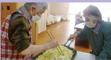
ご利用者様にもお手伝いいただき、おいしく作る事ができました★